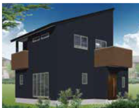
▲高気密・高断熱の構造と、ハイスペックな標準設備を採用し、モダンな印象の二階建て(画像はパースです)